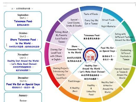
圖 2-13 二年級校本國際課程架構圖