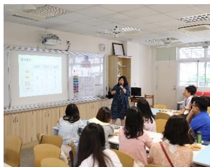
圖 2-3 與新北市新市國小跨校共備主題融入領域