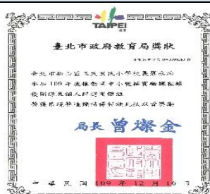
圖 2-14 本校榮獲教學評選團體情境營造類特優