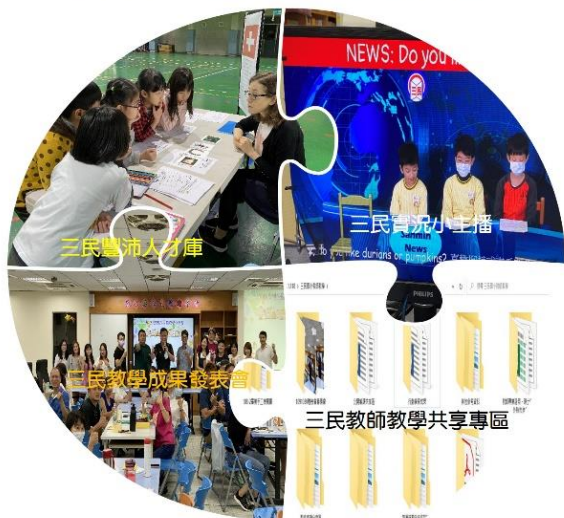
圖3-1 三民國小學校特色

(三) 跨域協同建平台，雲端隨選任我學： 本校建立教師教學共享平台(DNAS)、三民影音頻道數位平台(三民 Youtube 頻道)，內容含括全市國小首創「小主播」系列節目、教師教學資源共享專區、公開觀課紀錄與教學資料以及各領域教學專區等豐富完整的共享檔案，以雲端型態存放，大幅提升教師教學運用的便利性，並能持續凝聚彙整眾人的智慧資產，進行教師知識產出的傳承。