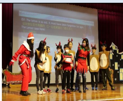
圖 2-7 聖誕節音樂劇演出藝文、國語文、英語文與自然領域等跨域教學展現