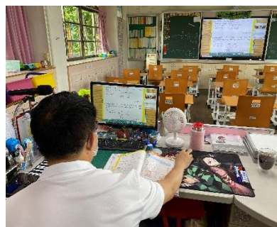
圖 2-8 110 年停課期間視訊直播課程