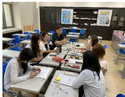
圖 2-12 每週跨域共同備課時間(雙語、自然、藝文...)