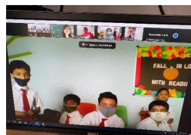
圖 2-16 連續三年與印度 Bright 小學進行視訊交流