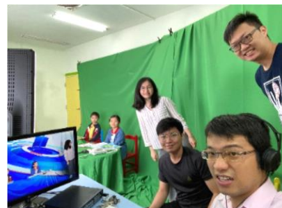
圖 2-10 三民影音專區的教材錄影情形