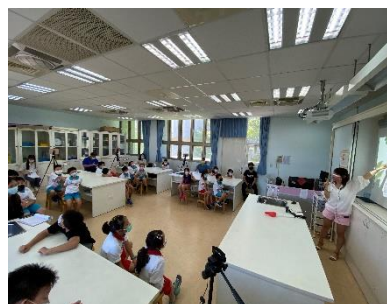
圖 2-4 三年級雙語、自然與英文課程協同教學公開觀課-首創分組直播線上與實體同步觀課模式