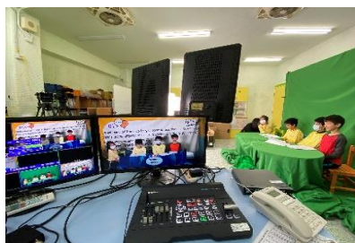
圖 2-2 數位即時導播平台-直播、去背與多畫面即時播出