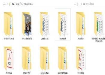
圖 2-1 教師教學豐富共享平台內容