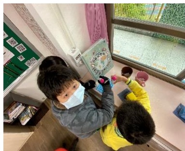
圖 2-6 教室共學角，自學共讀兩相宜