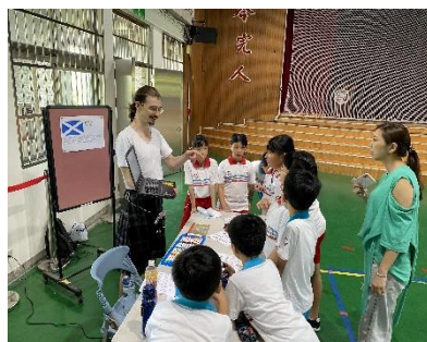
圖 2-15 國際文化闖關協同教學活動