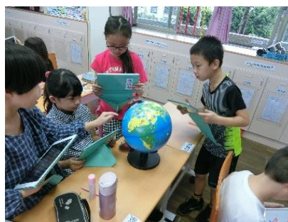
圖 2-9 Orboot AR 互動地球儀教學

讓孩子學習新知，是在自然使用的情境裡、有意義的學習。專家曾說：「語言是文化的載體，學習語言必須與生活、文化連結，孩子才知道為什麼要學。」三民國小從國際校本課程到雙語實驗學校，我們希望學生從學習的領域中，挑選適合的學習領域進行雙語課程。學科知能與語言學習達到同步整合，發揮最大效益。