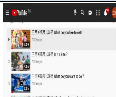
圖 2-11 三民小主播頻道