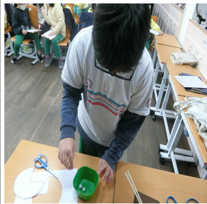
說明:第六關—擲骰子