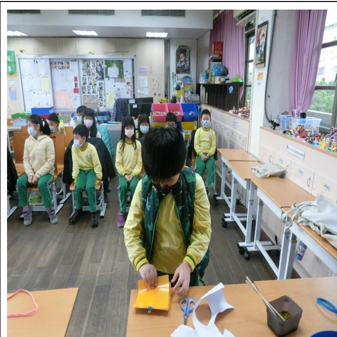
說明:第四關—數紙張