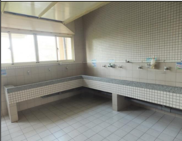
公共區設有洗衣空間和脫水機