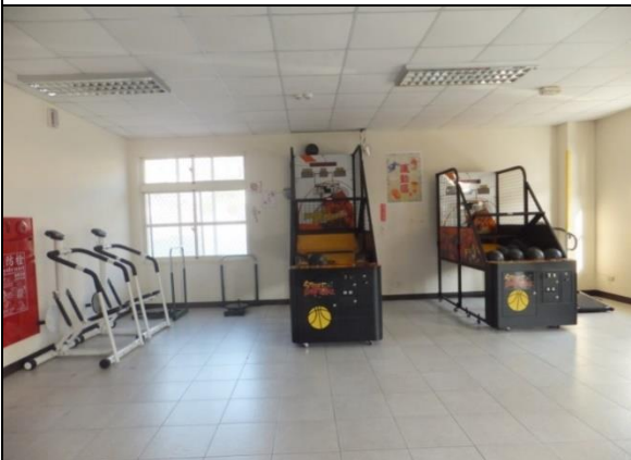
一樓設有籃球機、健身器材