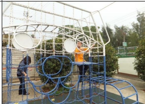
宿舍外有籃球場及遊樂設施