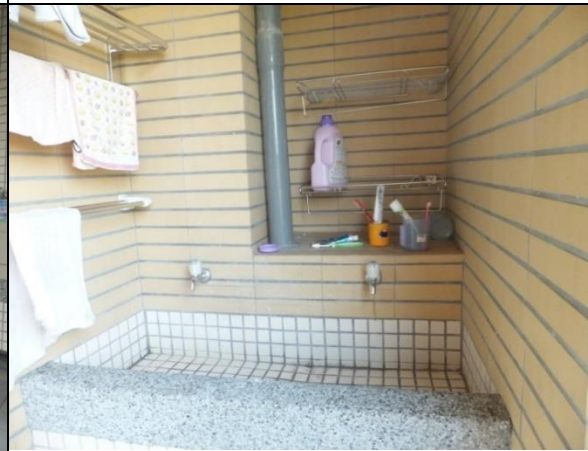
寢室設有獨立洗衣台及曬衣空間