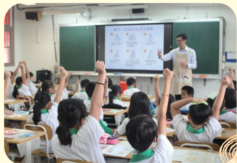
小朋友現場踴躍參與