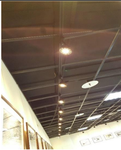
作品可拆式懸掛展燈(黃光)