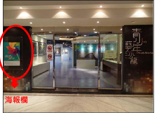
展場門口海報欄及形象牆