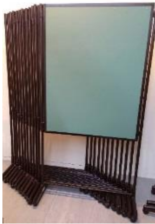
移動式海報架(80*120 公分)