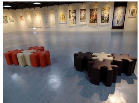
展場休憩拼圖椅(共 10 張)